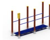
Paralela con huellas flotante PF02