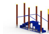
Escalera con distintos niveles EN03