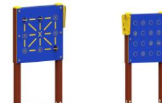
Panel doble "Formar parejas + Tres en raya" FPR28