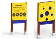
Panel doble "Pórtico + Diana" PD01

Pictures of Equipments/ Images des équipements / Imagens dos Equipamentos